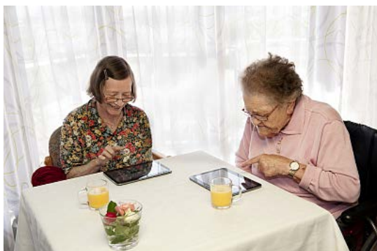
Tablets im Altenburgheim in Bad Cannstatt