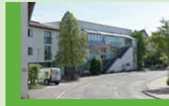
Haus an der Steinlach