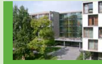
Haus am Kappelberg