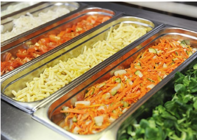
Damit er schön frisch bleibt, muss der Salat gekühlt serviert werden.

Spürbare Änderungen bei den Arbeitsprozessen in der Gemeinschaftsverpflegung gab es in den vergangenen Jahrzehnten auch in puncto Hygiene. Nachdem die ersten Fälle von Salmonellenbefall in deutschen Pflegeheimen auftraten, wurde das Infektionsschutzgesetz auf den Plan gerufen, das mit strengeren Vorgaben für mehr Kontrolle und Sauberkeit in der Küche sorgte. So gehört es beispielsweise der Vergangenheit an, Speisen mit rohem Ei zuzubereiten oder Frühstückseier zu reichen. Für Rührei darf heute ausschließlich pasteurisiertes Ei verwendet werden. Hygieneschulungen des Küchenpersonals und genaue Temperaturvorgaben, wie beispielsweise die Kühlung des Salats auf sieben Grad, sorgen für Sicherheit. Zudem sind Küchenteams verpflichtet, eine Rückstellprobe des Essens zu nehmen, um bei einem Krankheitsausbruch zu belegen, dass dieser nicht durch eine Mahlzeit ausgelöst wurde.