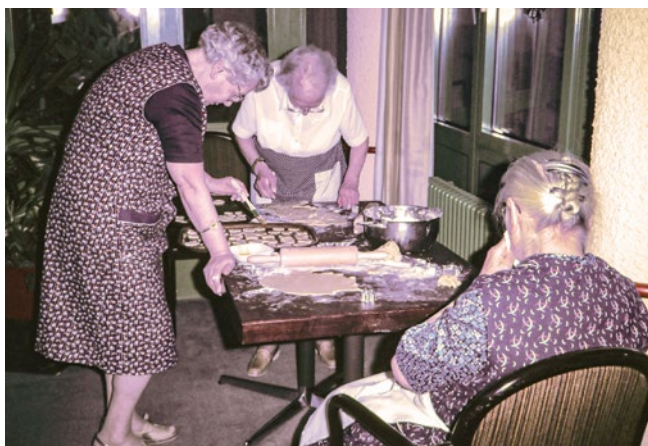
Altenburgheim 1984: Alle Jahre wieder werden Plätzchen gebacken.

Für das Plus an Gesundheit sorgen vegetarische Gerichte, die in den meisten Einrichtungen erst im Lauf der Zeit mehr und mehr angefragt werden. Heute stehen sie in der Regel täglich zur Auswahl. Bevorzugt wird allerdings von den meisten Bewohnern eine fleischhaltige Kost – für viele von ihnen ein Symbol für „gute Küche“. Für die Pflegeheime gibt es daher in Zukunft noch Verbesserungspotenzial, wenn es um Nachhaltigkeit und pflanzliche Kost geht.