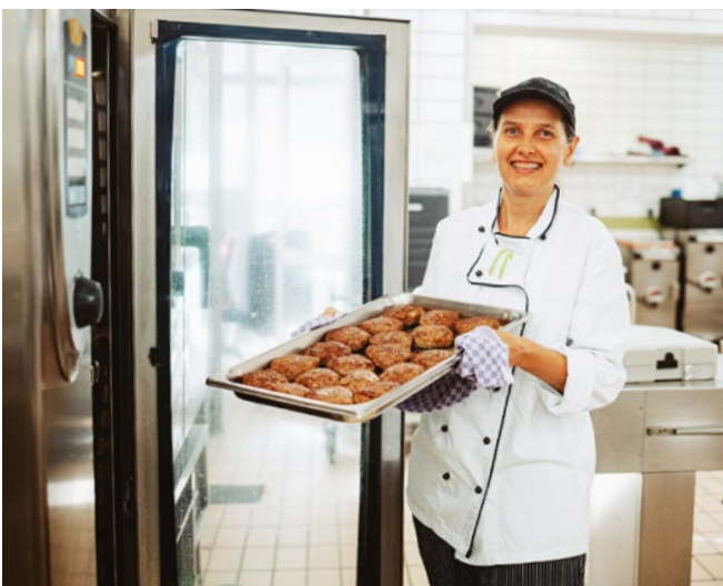
Die Bratlinge garen im Cooking Center. Darin ist genug Platz, um für alle Bewohner gleichzeitig zu kochen.