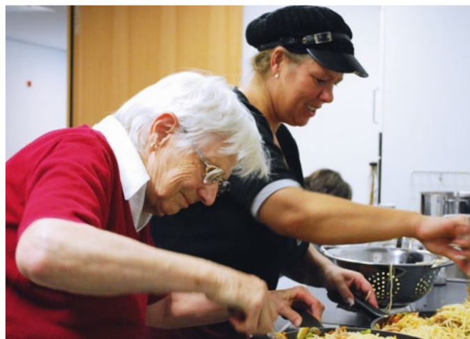
Haus am Kappelberg 2008: In ihrer Wohngruppe können sich Bewohner ganz unkompliziert einbringen.