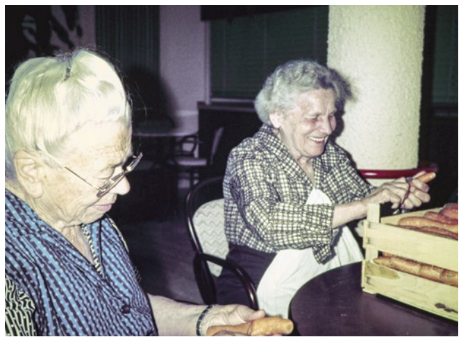
Altenburgheim 1986: Fleißig wird beim Gemüseputzen geholfen.

Die Vorteile liegen jedoch auf der Hand: Bewohner können die Zubereitung der Mahlzeiten beobachten, sich einbringen und den Duft genießen, der in ihrem Wohnbereich ein leckeres Essen verspricht. Sie können ihre Wünsche direkt äußern und kommen in den Genuss von Gerichten, wie Waffeln oder Pfannkuchen, die in einer zentralen Küche nicht ohne Weiteres frisch zubereitet werden können. Auch davon wird es in Zukunft Fotos geben, die dokumentieren, dass leckeres Essen einen entscheidenden Beitrag für das gelungene Leben in den Einrichtungen des Wohlfahrtswerks leistet.