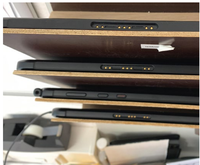
Ladestation für Tablets – auch die beste Software benötigt einen geladenen Akku.

Wohlfahrtswerk Protokolle des AK Pflege 10/1994 sowie 12/1995