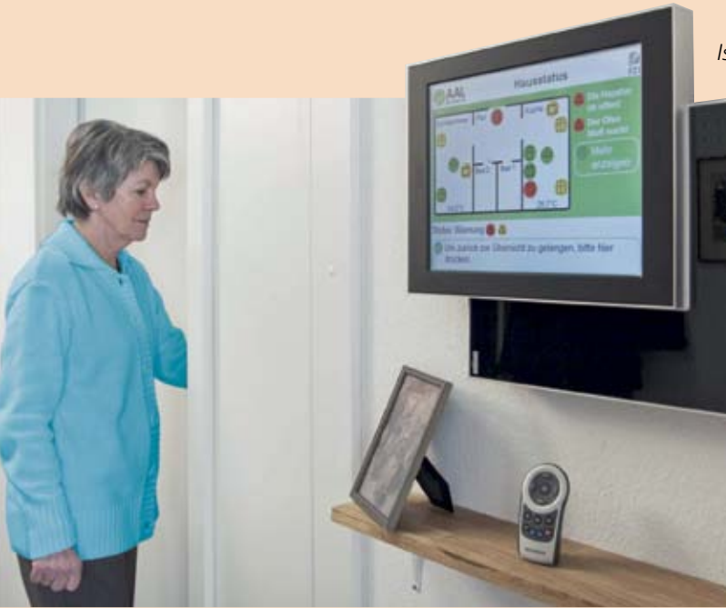
Ist der Ofen aus? Ein Bildschirm als Erinnerungshilfe