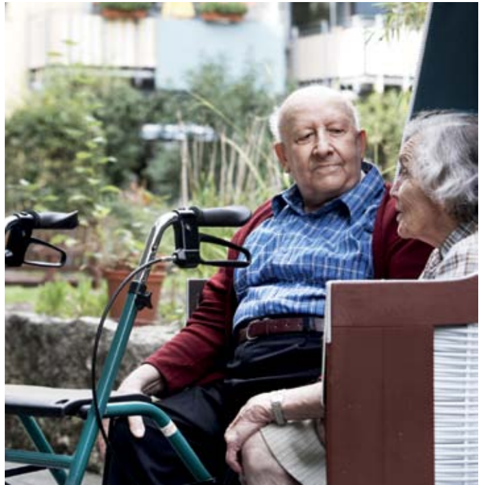
Gespräch im Strandkorb: Gäste der Tagespflege im Ludwigstift

Die Vorteile der Tagespflege liegen also auf der Hand und so ist es nicht verwunderlich, dass sie von Beginn an ein ‚Wunschkind‘ der Politik war. Bereits 1994 wurde das Angebot gesetzlich verankert und seitdem durch die Pflegekassen bezuschusst. Die Pflegereform von 2008 brachte hier noch eine Verbesserung: Während zuvor Zuschüsse für einen ambulanten Pflegedienst und für Tagespflege gegeneinander verrechnet wurden, ist es heute möglich, diese zu addieren. Wer also einen Pflegedienst beschäftigt und die Tagespflege besucht, kann monatliche Zuschüsse von bis zu 660 Euro in Pflegestufe 1 und bis zu 1.560 Euro in Pflegestufe 2 erhalten. Diese Vorteile scheinen sich langsam herumzusprechen: Wie eine aktuelle Erhebung des Wohlfahrtswerks zeigt, nutzen heute fast 30 Prozent der Tagespflegegäste parallel einen Pflegedienst, fünf Jahre