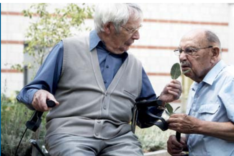
Dufterlebnisse im neuen Sinnesgarten

Um die Nutzung des Gartens für alle Bewohner zu ermöglichen, wurde auf einen barrierefreien Zugang geachtet. Die Beete sind als Hochbeete angelegt, so dass man sie auch aus einem Rollstuhl heraus bequem erreichen kann. Ein von allen Punkten aus sichtbarer Pavillon dient zum Ausruhen und Verweilen – und auch der Orientierung. Der Bewegungsdrang vieler demenzerkrankter Menschen wird durch einen Rundweg in Form einer ‚kinesiologischen Acht‘ berücksichtigt, der in Schleifen angelegt ist und nach jedem Spaziergang wieder zum Ausgangspunkt zurückführt. Gleichzeitig ist der Sinnesgarten so überschaubar, dass Betreuungskräfte die