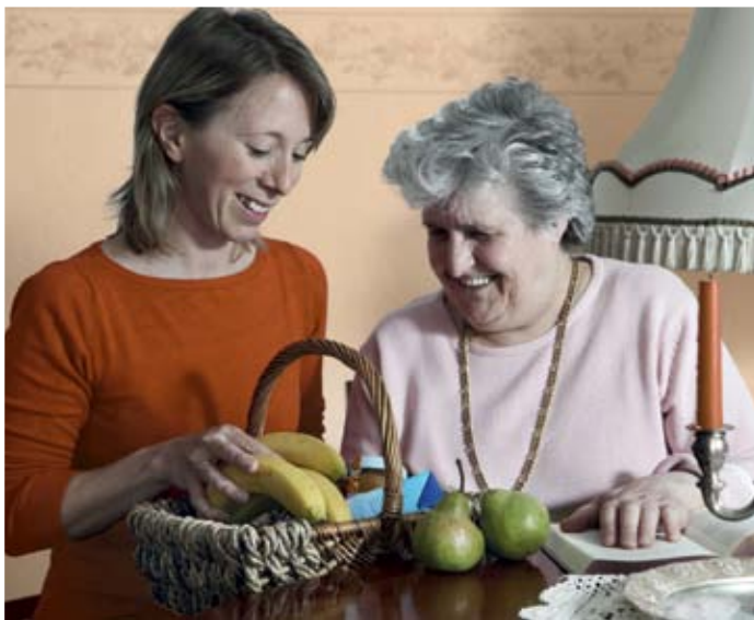
Unterstützung in der gewohnten Umgebung