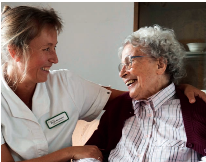
Freundliches Personal wird geschätzt

Ein weiteres wichtiges Thema ist die Zufriedenheit mit dem Personal, der Organisation und den Angeboten im Haus (Abbildung 1). Das Ergebnis: Die Betreuung durch das Personal, dessen Freundlichkeit, Umgangsformen und Hilfsbereitschaft werden ebenso positiv eingeschätzt wie die Wahrung der Intimsphäre oder die Möglichkeit, den Tag frei zu gestalten. »Völlig zufrieden« äußert sich dazu ein Viertel der Befragten. Nachdem sich dieser Wert bei der letzten Befragung glatt verdoppelt hatte, ist er 2009 wieder leicht gesunken. Weitere 68 Prozent geben an, dass sie »zufrieden oder eher zufrieden« seien und knapp sieben Prozent zeigen sich »nicht zufrieden«. Die Werte haben sich damit im Vergleich zu 2007 etwas verschlechtert.